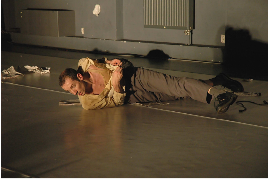
Extrait du spectacle La Fêlure du Papillon